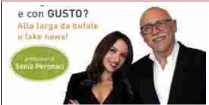
"Free from fake", come difendersi dalle bufale a tavola