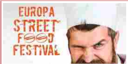
Tra chef nazionali e piatti Gourmet va in scena l'Europa Street Food Festival