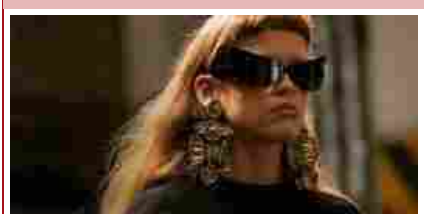
Ai Musei Capitolini Gucci e l'omaggio a Roma con Elton John