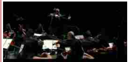
Assassin's Creed diventa una spettacolare sinfonia multimediale [VIDEO]